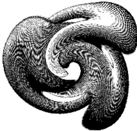
Figura 4.1: M.C. Escher sotto acido.